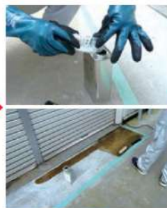
プライマー塗布 (JCIIのみ)