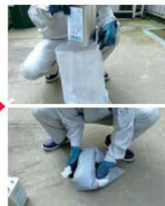
樹脂と骨材の混練

プライマー硬化後、モルタル用骨材袋に、モルタル用樹脂を全量投入し、揉みほくすように混練します。